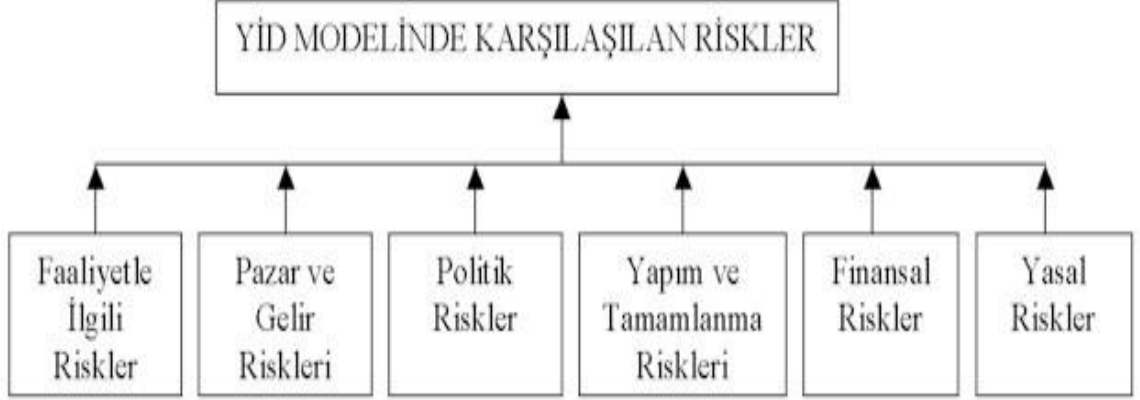
Şekil 1: YİD Projelerinde Karşılaşılan Riskler (www.baker.comhk)

projeleri, planlı ve kontrollü risk analizlerini gerektirmektedir. YİD projelerinde karşılaşılan riskleri genel olarak aşağıdaki başlıklar halinde toplayabiliriz.