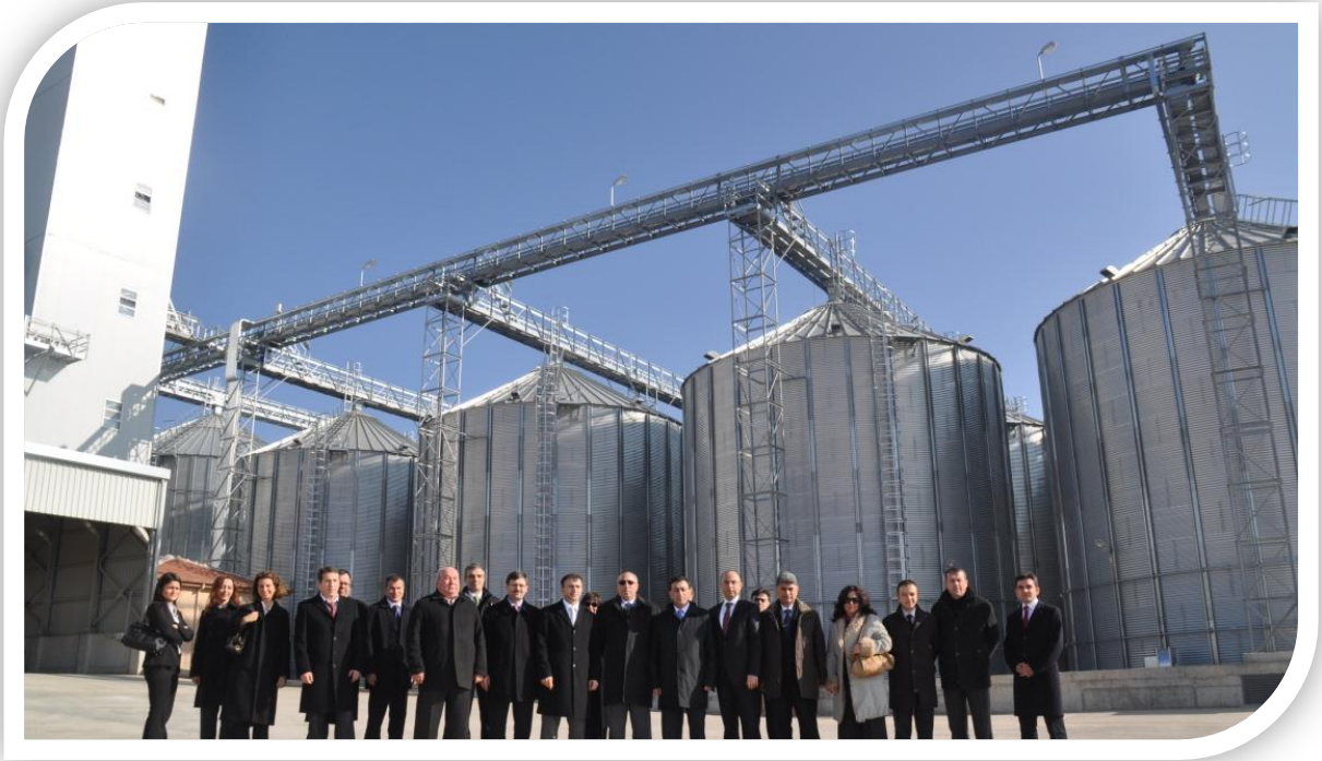
TMO-TOBB Tarım Ürünleri Lisanslı Depoculuk A.Ş. Açılış Töreni

Pilot şirket olarak kurulacak diğer şirketlere örnek teşkil etmesi için Toprak Mahsulleri Ofisi (TMO) iştirakiyle “ TMO-TOBB Tarım Ürünleri Lisanslı Depoculuk A.Ş. ” kurulmuştur. Bu kapsamda; TMO, Türkiye Odalar ve Borsalar Birliği (TOBB), Ordu İl Özel İdaresi, Umumi Mağazalar Türk Anonim Şirketi, Gümrük ve Turizm Ticaret İşletmeleri Anonim Şirketi tarafından TMO-TOBB Tarım Ürünleri Lisanslı Depoculuk Sanayi ve Ticaret Anonim Şirketi 05.02.2010 tarihinde kurulmuştur.