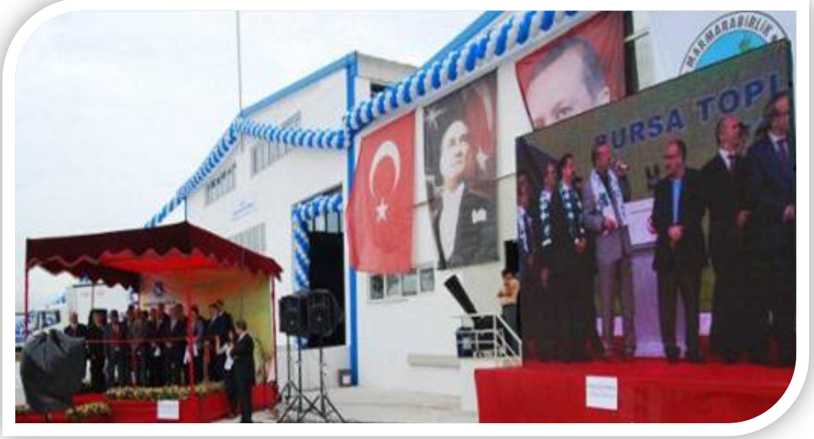
Marmarabirlik Lisanslı Depoculuk A.Ş. Açılış Töreni

Marmarabirlik Lisanslı Depoculuk A.Ş. de lisanslı depoculuk için yaklaşık 17 milyon dolarlık büyük bir yatırım yapmıştır. Yüzde 50'si Dünya Bankası ve Hazine Müsteşarlığı kaynaklarından, yüzde 50'si de Marmarabirlik öz kaynaklarından karşılanan proje kapsamında 5 bin ton kapasiteli Başköy Lisanslı Zeytin Deposu, 8 bin ton kapasiteli Erdek Lisanslı Zeytin Deposu, 4 bin ton kapasiteli Başköy Lisanslı Zeytinyağı Depo inşaatları tamamlanmıştır.