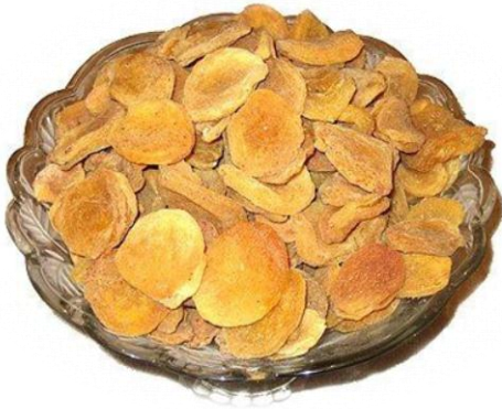
Şekil 2: Afganistan Kayısı